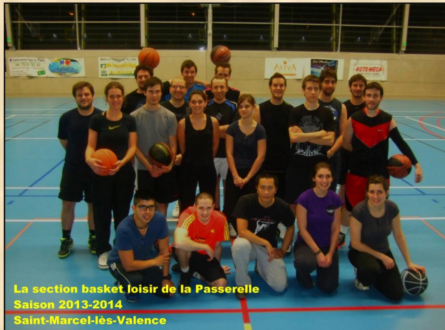
La section basket loisir de la Passerelle Saison 2013-2014 Saint-Marcel-lès-Valence