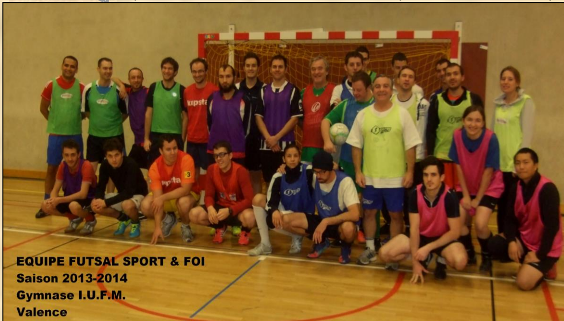
EQUIPE FUTSAL SPORT & FOI Saison 2013-2014 Gymnase I.U.F.M. Valence